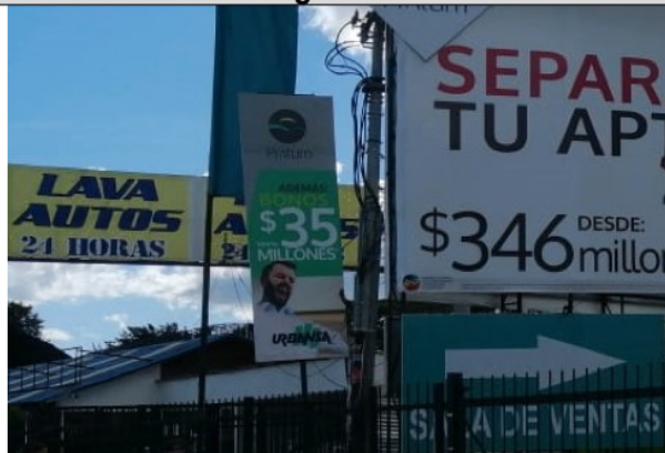
Avisos tipo colombina son dos (2)